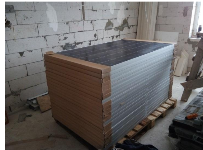
Поликристаллические панели ABI Solar