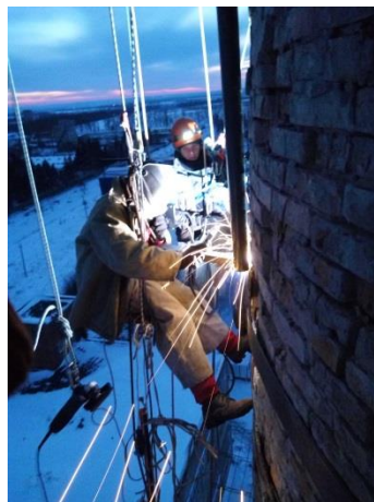
Сварочные работы на промышленном дымоходе при монтаже антенно-фидерного оборудования(2 баз.станции)