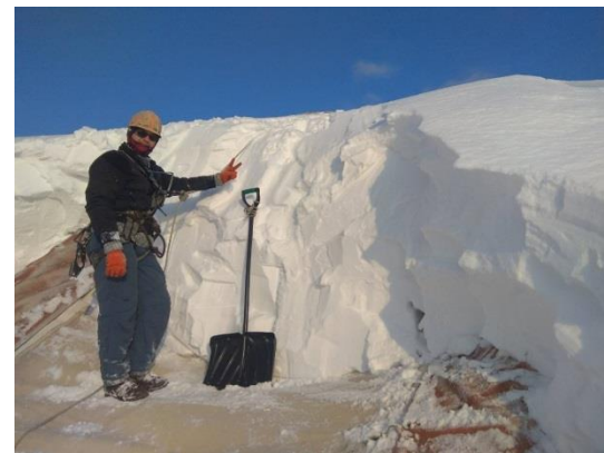
Чистка тентовой кровли от снега и наледи более 10 000 м 2