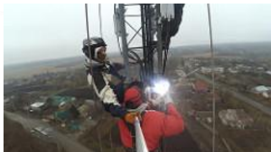
Монтаж антенно-фидерного оборудования (3 баз.станции)